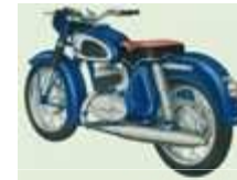
Bild ähnlich, 500 Km gefahren

Mein erstes eigenes Motorrad-Verkauft 2013 wegen Platz- und Zeitmangel an Sammler